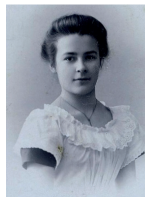
Рис. 7. Тайна юношеских чувств Израиля Перельмана [1905]. Fig. 7. The secret of youthful feelings of Israil Perelman [1905].

Юноша испытал чувства невероятной симпатии к ровеснице с приятным открытым лицом, на котором примечательно ютились прямые разлетающиеся брови и обрамлённые распахнутыми ресницами чёрные глаза, способные излучать только добро. В них не было места для грусти и печали. Образ дополняла причёска, собиравшая волосы вверх и сзади в небольшой пучок, который удерживался декоративным гребешком. По бокам же из неё выбивалась непослушная малость кудряшек, выдававшая детскую непосредственность хозяйки. Обезоруживало буквально всё: и чуть вздёрнутый носик, и прямой взгляд, и слегка припухшие губки, смыкавшиеся в идеальную линию приветливой улыбки. Чудесную картинку завершал широкий лоб, свободный от беспечных волос-завлекашек, и несколько выдвинутый вперёд подбородок (рис. 7). Можно ли было пройти мимо такой прелести и не обратить внимания? К тому же это божественное создание ответило взаимностью.