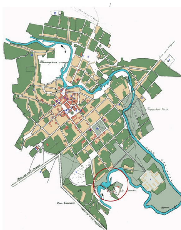
Рис. 2. Ляховка на плане Минска [1820 г.]. Fig. 2. Lyakhovka on the plan of Minsk [1820].

Далеко не всем были по душе деяния знахаря. В 1880 г. накануне празднования 900-летия крещения Руси с ведома властей потушили негаснувший до толе священный огонь, засыпали источник, а вещий дуб спилили. Радостям церковнослужителей не было предела, они прогнали Севастея, отобрав и камень, и все молельные принадлежности. В качестве главного объекта почитания нарекли «анало» – ящик с крестом, кадило, Евангелие и миску для денежных приношений. А служить поставили отца Яфимия, который, как оказалось вскоре, на самом деле был крепостным, бе-