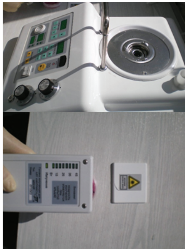
Рис. 1, 2. Воздействие на культуру микроорганизмов аппаратом АЛТ «Матрикс», тип МЛЮ1КР.

При проведении статистической обработки руководствовались методикой определения среднего ква-