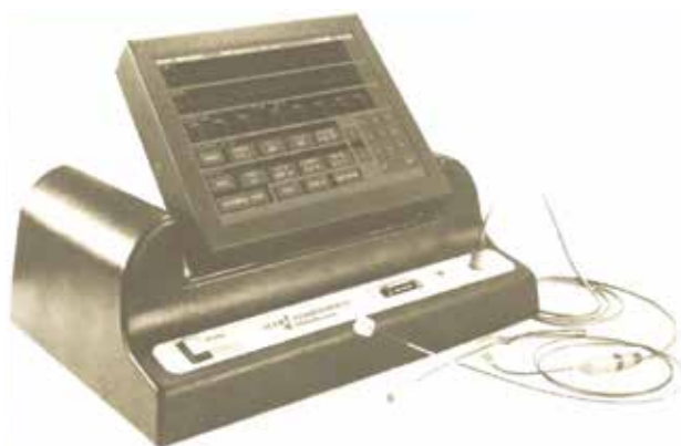
Рис. 1. Внешний вид системы ALERT Companion II для низкоэнергетической эндокардиальной ДФ.