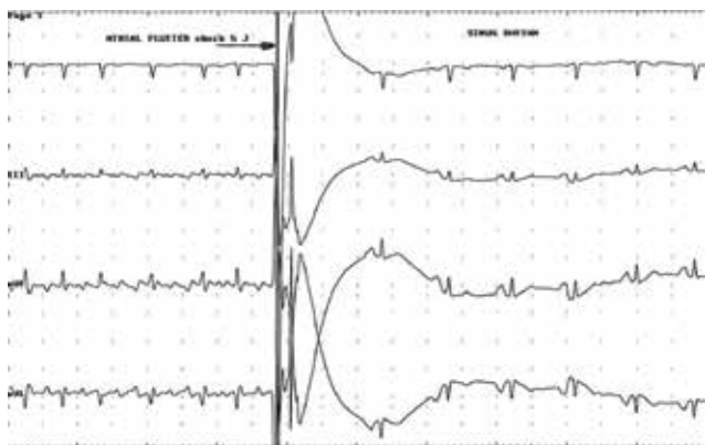
Рис. 3. ЭКГ в момент восстановления синусового ритма в результате эффективной эндокардиальной ДФ с использованием энергии 5 Дж. (сверху вниз I, III, aVF, aVL – отведения поверхностной ЭКГ, стрелкой показан момент нанесения шока энергией 5 Дж, длительностью 8 мс).

на мысль, что такая терапия может быть приемлема для лечения ФП [6, 8]. Развитие различных технологий лечения ФП привело к созданию однокатетерной системы для низкоэнергетической эндокардиальной ДФ предсердий [10, 11]. Данные о патогенезе ФП предполагают, что быстрая детекция и немедленное купирование приступа ФП, теоретически могут предотвращать рецидивы аритмии [12].