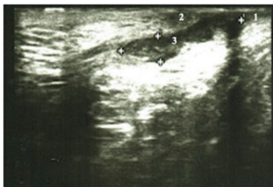
Рис. 2. Пациент В., 43 лет. Эхограмма заднего трансфинктерного свища заднего прохода, захватывающего более 30% сфинктера. 1 - внутренний сфинктер, 2 - наружный сфинктер, 3 - свищевой ход.

Fig. 2. Patient V., 43 years old. An echogram of the posterior complex transsphincteric fistula. 1 - musculus sphincter ani internus, 2 - musculus sphincter ani externus, 3 - fistula.